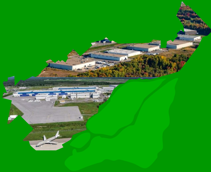
Table des préfets et élus de la couronne Nord

Commentaires déposés dans le cadre des consultations de la Commission du développement économique, des finances et de l'emploi de la CMM portant sur le Projet de Plan métropolitain de développement économique 2022-31