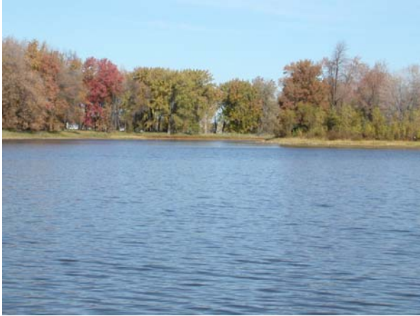
Vue du chenal entre les îles Boutin et Lapierre.