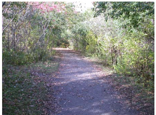
Un des sentiers aménagés le long du ruisseau De Montigny.