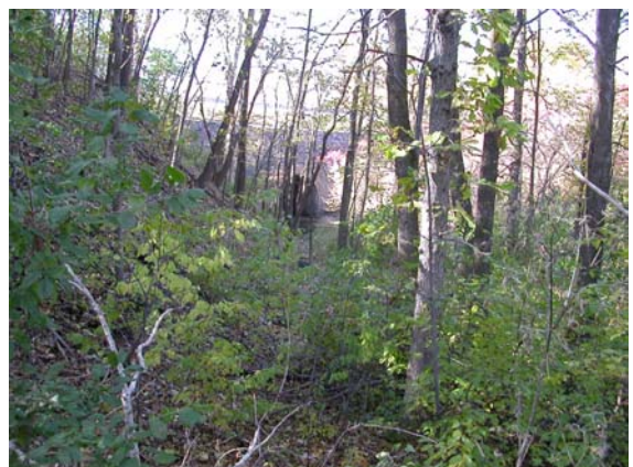
La frênaie rouge mature près du boulevard Perras.