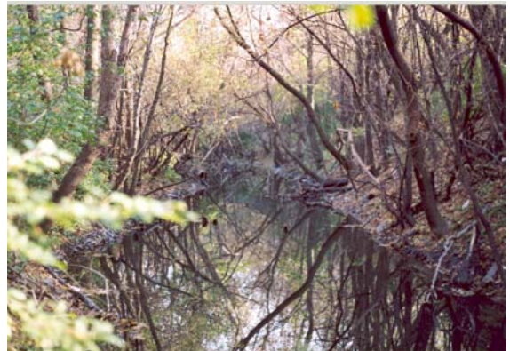
Vue des rives escarpées du ruisseau De Montigny plus en amont du boulevard Maurice-Duplessis.