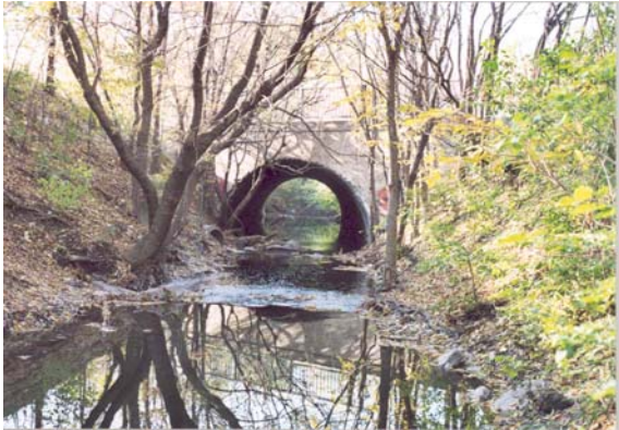
Jeune frênaie rouge jeune colonisant les rives escarpées du ruisseau De Montigny au sud du boulevard Maurice-Duplessis.