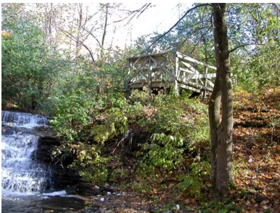
Belvédère aménagé au dessus de la chute spectaculaire du ruisseau De Montigny.