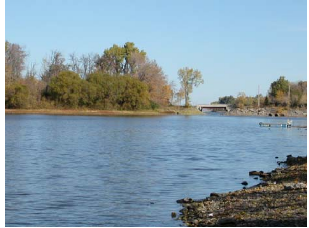
Vue de l'érable argenté sur l'île Lapierre. Un pont la relie à l'île de Montréal.